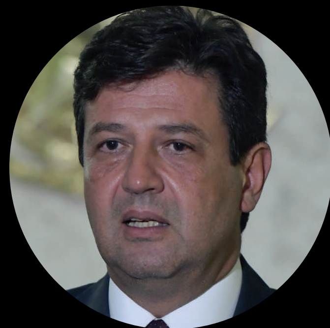
LUIZ HENRIQUE MANDETTA

Presidente do Conselho Deliberativo da Sociedade Beneficente Israelita Brasileira Albert Einstein